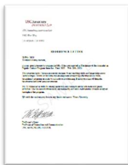
学员推荐证明信（示例）