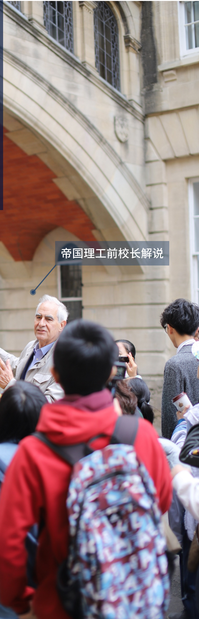
帝国理工前校长解说